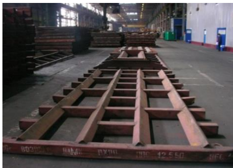
Рис. 7 Рама «Полимерная» ( 8 ячеек )