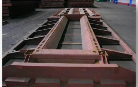
Рис. 6 Рама «Экспериментальная» (Р-2)