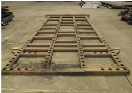
Рис. 11 Рама «ВО ПГП» (P-1)