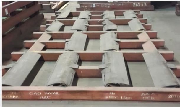
Рис. 5 Рама «ГО ПДС» ( 7 ячеек )