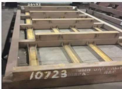
Рис. 9 Рама «ВО ПДС»