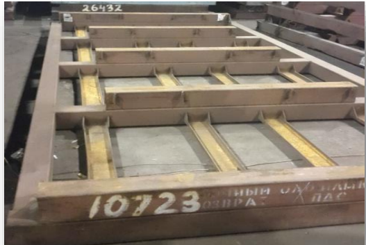
Рис. 9 Рама «ВО ПДС»