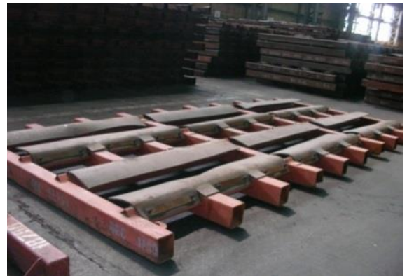
Рис 8 Рама «ГО ПХПП» ( 6 ячеек )