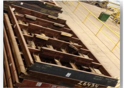
Рис. 10 Рама «ВО ПТС»