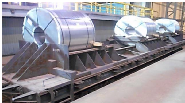
Рис.1 Тяжелая платформа

Владельцем платформ на правах аренды является ПАО «НЛМК». После выгрузки платформы должны быть возвращены на станцию Новолипецк в адрес ПАО «НЛМК». Выгрузку и предъявление порожних платформ к возврату необходимо производить в сроки установленные договором.